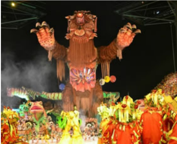
Roda de Boi-Bumbá (São Paulo-SP) Festival Folclórico de Parintins (AM)