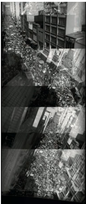
"25 de Março"