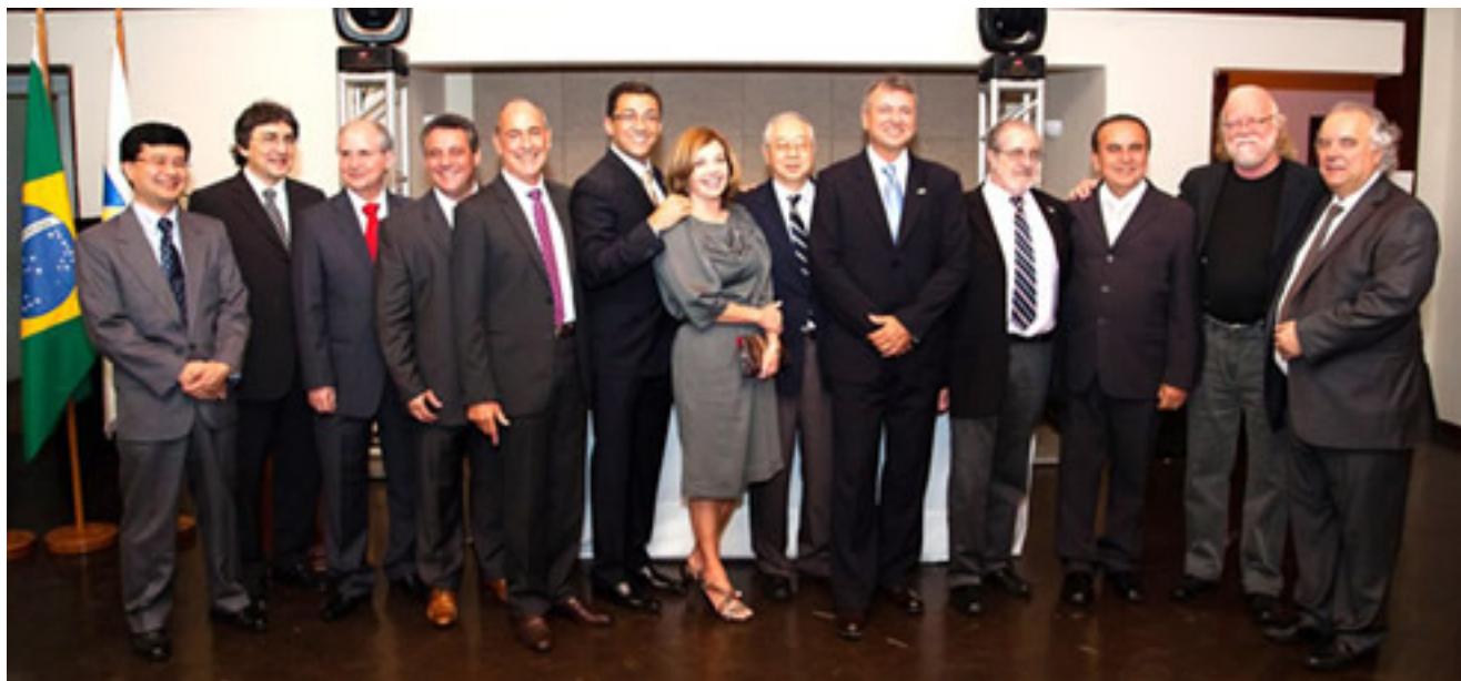
Componentes da nova Diretoria e Membros do

Escrito por Maria Helena Ter, 15 de Abril de 2014 01:11 -